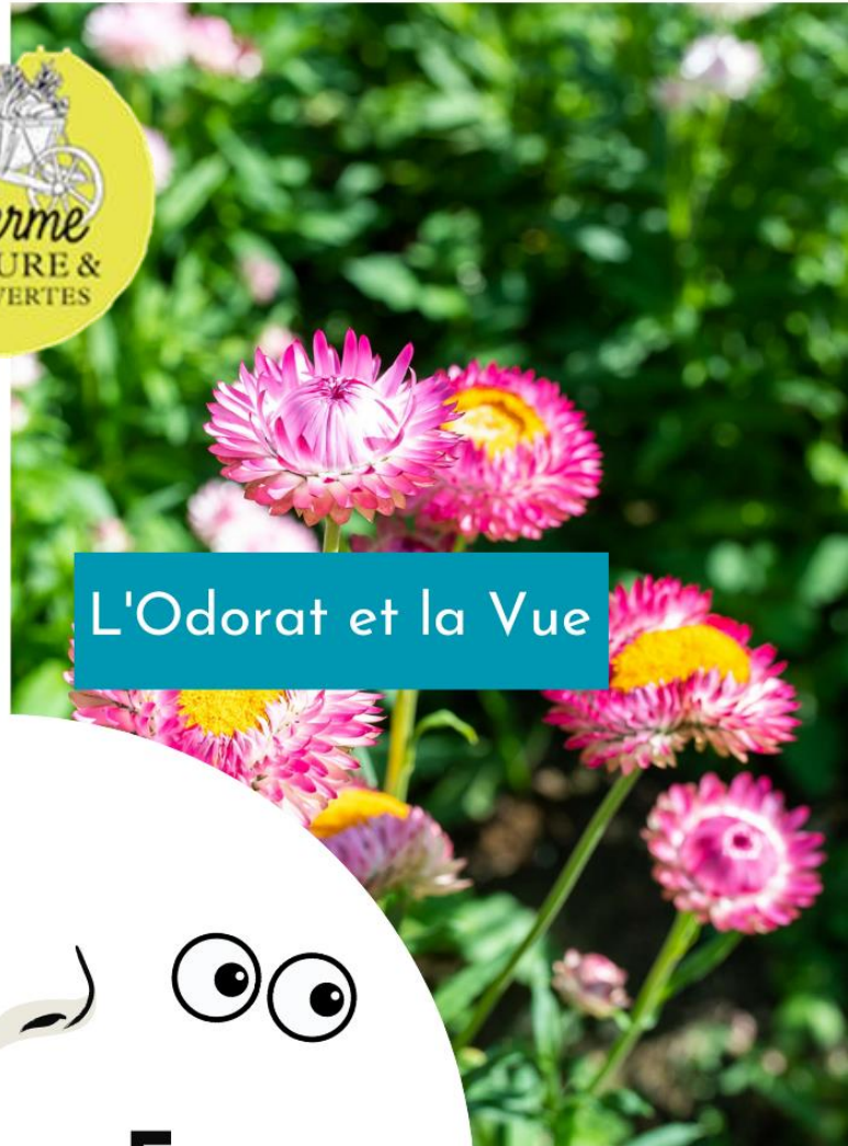
L'Odorat et la Vue